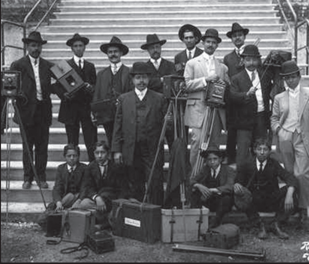
Fotórreporteros de la Ciudad de México, 1910. Manuel Ramos. Ramos y Cía. Fots.