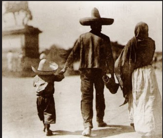
Familia mexicana, 1925